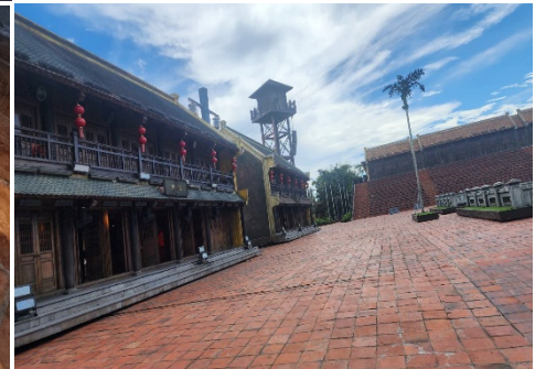
นำท่านเช็คอินโรงแรม VinHoliday Fiesta Hotel หรือเทียบเท่า